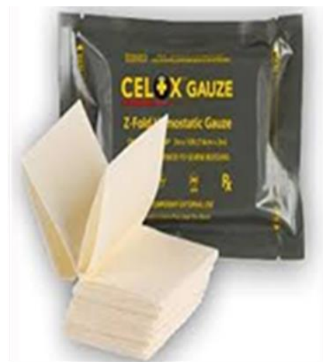
شکل-۵. فرم مش پانسمان Celox

Coolclot: پد انعقاد خون که به دلیل ویژگی‌هایی مانند: ۱. کاهش شدید حجم خون خارج شده از محل جراحی ۲. کاهش زمان انعقاد خون ۳- کاهش زمان تشکیل لخته ۴. کنترل قابل ملاحظه واکنش‌های آگزوترمیک و عدم افزایش بیش از حد دما در محل خونریزی و همچنین جلوگیری از بروز سوختگی موضعی ناشی از استفاده موضعی ۵. عدم وجود عوارض جانبی مشهود ۶. اقتصادی بودن تولید انبوه این عامل انعقادی به خاطر فراوانی معادن کانی‌های مورد نظر در ایران و قیمت تمام شده بسیار پایین‌تر از نمونه‌های موجود ۷. قابلیت استفاده در میدان جنگ برای سربازان زخمی شده با حجم‌های بالای خونریزی، ورزشکاران، آمبولانس‌های اورژانس توصیه می‌شود (۱۳).