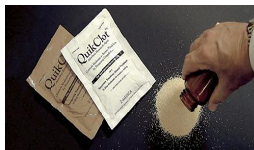
شکل-۶. پودرهای گرانوله QuikClot

معدنی پودرهای گرانوله از مواد معدنی هستند (شکل-۶). این پودر ترکیبی از سلیکون، آلومینیوم، منیزیم و سدیم است. این محصول قابلیت استفاده آسان دارد هزینه تهیه آن نسبتاً پایین است. نوع پودری آن در خونریزی‌های با شدت جریان پایین بسیار مؤثر بوده، اما در خونریزی‌های با شدت جریان بالا به علت شسته شدن مواد با جریان شدید خون با خطاهای بالایی روبرو بوده است. کاهش تأثیر QuikClot در جریان خون بالا باعث شد تا شرکت تولیدکننده، در فرم‌های جدید، مواد Mineral Zeolite را با باند و گاز ترکیب و تولید نماید (۱۱).