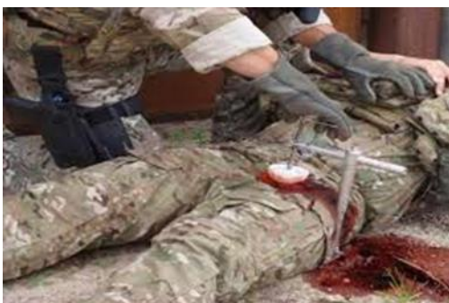
شکل-۱. "CROC" Combat Ready Clamp

خونریزی خارجی شامل دو دسته خونریزی می‌گردد: ۱. خونریزی‌های اندام‌های فوقانی و تحتانی (extremity) (هدر رفت خون ناشی از پارگی عروق در دست و پا) ۲. خونریزی‌های تقاطعی اندامها با بدن (junctional) (هدر رفت خون ناشی از پارگی عروق در فضای فوقانی کشاله ران بسمت کانال اینگوئینال شکمی (شکل-۱).