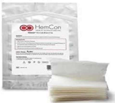
شکل-۳. پانسمان HemCon

مزیت دیگر برند HemCon وجود PH اسیدی آن است که باعث بروز خواص آنتی باکتریال در این نمونه شده است، PH اسیدی موجود در این نوع پانسمان موجب انهدام دیواره باکتری‌های گرم منفی می‌گردد. اگرچه آزمایشات HemCon در نمونه‌های انسانی محدود بوده است، اما آزمایشاتی که روی نمونه‌های حیوانی انجام شده است بسیار موفقیت آمیز بوده. زمانی که HemCon روی طحال خوک در حال خونریزی گذاشته شد فرایند انعقاد ۱۰ برابر زودتر از حالت استفاده از گاز معمولی رخ داد.