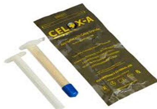
شکل-۴. فرم تزریقی پودر Celox

Chitotech: محصولات بند آورنده خونریزی شرکت کیتوتک ایران از پلیمرهای زیستی طبیعی برپایه سلولز تهیه گردیده‌اند و موجب تسریع توقف خونریزی‌های شریانی، وریدی و مویرگی در تروماها، اعمال جراحی، کاتترهای آنژیوگرافی، دندانپزشکی، خونریزی‌های بینی و دهان و دندان، ختنه، برش‌های تروماتیک پوست و مشکلات دیالیزی و عروقی می‌گردند (۱۲).