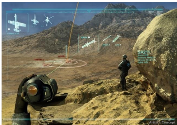
شکل-۴. سیستمی برای استقرار پشتیبانی فوری نزدیک هوایی (PIK-AS Project)

هوایی (PIK-AS Project): تاکتیک پشتیبانی نزدیک هوایی که در آن به سربازان دستور داده می شود تا از طریق حملات هوایی بتوانند در جریان درگیری های زمینی وارد شده و از فرصت استفاده کنند از زمان آغاز در جنگ جهانی اول تاکنون به طور نسبی بدون تغییر مانده است. در پشتیبانی نزدیک هوایی عادی، خلبان ها و نیروهای زمینی در یک لحظه از طریق نقشه مشترک بر یک هدف متمرکز می شوند. برنامه پایدار پشتیبانی نزدیک هوایی دارپا یا پیکاس با هدف تعریف مجدد و اساسی این مفهوم طراحی شده است. پیکاس می تواند نیروهای زمینی را قادر سازد تا بتوانند اطلاعات دقیق مکانی و تسلیحاتی مشترکی با نیروی مسلح هوایی داشته باشند. این مسئله هوایما را قادر می سازد تا بتواند به طور همزمان بر چند هدف تمرکز کند. پیکاس همچنین برای کاهش چشمگیر زمان بین حمله هوایی و ورود هوایما در میدان نبرد طراحی شده است (شکل-۴) (۵۸).