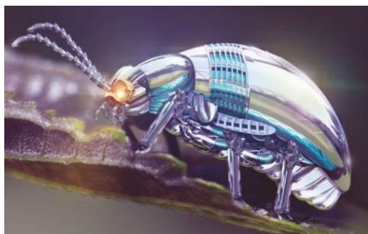
شکل-۳. حشره سایبری

حشرات سایبری (Cyber insects): یکی دیگر از پروژه های در حال اقدام، استفاده از حشرات برای استفاده جاسوسی از این موجودات است، در این پروژه، با استفاده از تکنولوژی نانو، ریزپردازنده ها و دوربین هایی همراه با جی پی اس، روی بدن حشرات قرار گرفته و این حشرات می توانند به صورت مستقیم عکس و فیلم را به مرکز کنترل ارسال کنند (۵۲). انرژی بکار رفته در این حشرات برای عکس و فیلم برداری، با استفاده از تبدیل انرژی میکانیکی بال حشره به انرژی الکتریکی تأمین می شود. این پروژه به دو شکل استفاده از حشرات واقعی و حشرات مصنوعی انجام می شود. همچنین حشراتی شبیه پشه و مگس ساخته شده است که از کوچکترین روزنه اتاق می تواند وارد شود و بر شخص مورد هدف فرود آمده و همانند پشه که نیش خود را در بدن شخص فرو می کند، همان نیش را که حاوی سم است وارد بدن شخص می کند و فرد را از بین می برد (شکل-۳).